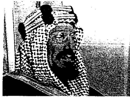
المغفور له الملك عبد العزيز

«السلاط عليكم ورحمة الله وبركاته على الدوام، بعد ذلك تدرون بحالنا وأمرنا خارجنا وقل الوارد ولا هرب من فقر بلادنا بل هي اعنى من غيرها، وأنا لعدد أخراج ما فيها من المصالح ولا بد جاكه خبر اتفاقنا مع الشركة لأجل استخراج المعادن الغازية والاستفادة من معادن ومصالح بلادنا المكتونة وسوف يبتدىء العمل بها قريباً إن شاء الله تعالى، فهدى الشركة خصوصاً من حصصها مئة وعشرين ألف سهم يكون منها ستين ألف سهم هذه لنا